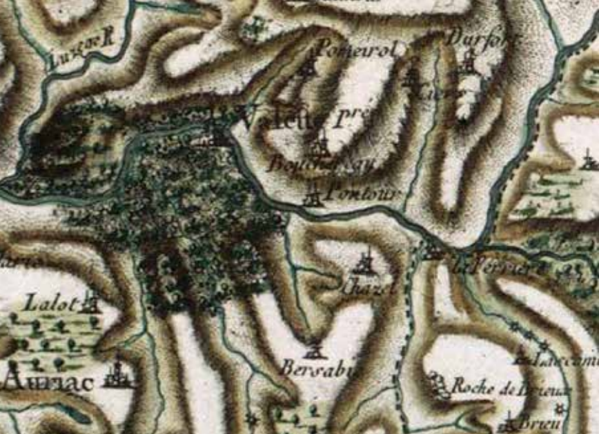
Carte de Cassini - XVIIIe siècle